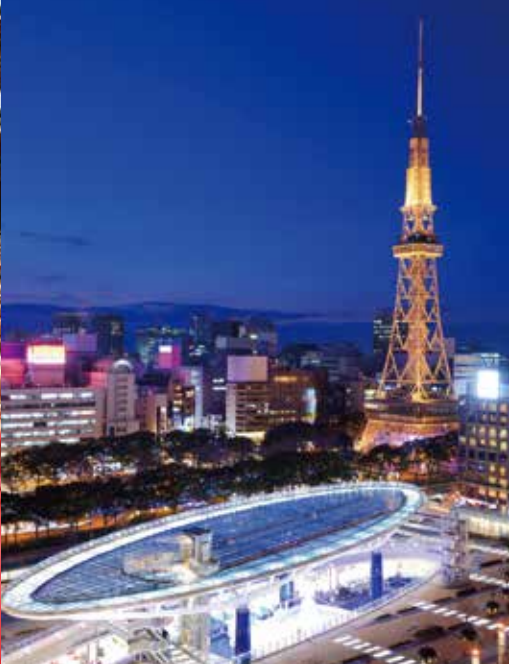
名古屋电视塔 绿洲21